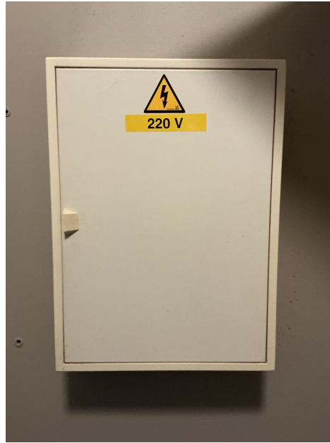
( Elektrisch bord )